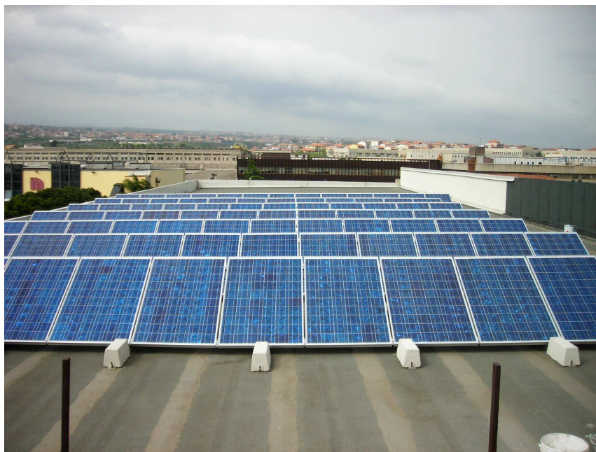
fig.4: Spaccato di impianto parzialmente integrato 18,6 kWp