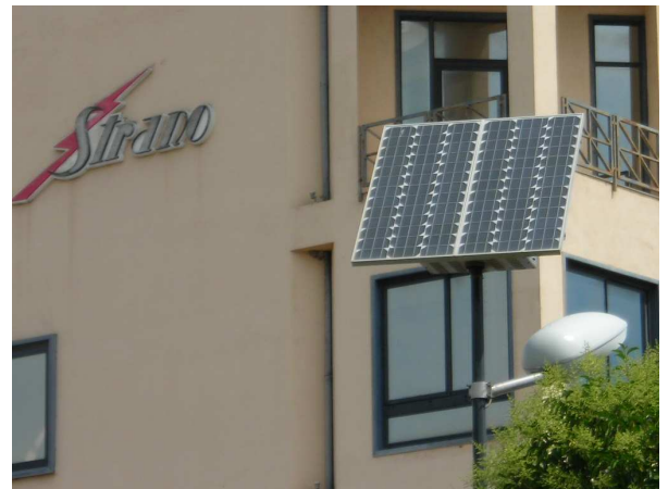
fig. 2 : lampione fotovoltaico impianto demo Strano SpA sede zona industriale

Gli impianti fotovoltaici stand alone sono costituiti essenzialmente da: pannelli fotovoltaici, parco batterie e da uno o più inverter. L'energia elettrica continua prodotta dai pannelli viene accumulata dalle batterie e trasformata dall'inverter in corrente alternata quando si rende necessaria. Questi sistemi vengono utilizzati in tutti quei casi dove non sia possibile connettere l'impianto con la rete elettrica (case di campagna, capannoni agricoli etc).