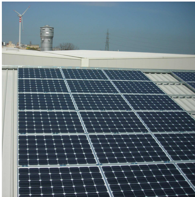
fig.5: Spaccato di impianto totalmente integrato 48,6 kWp

Strano SpA Filiale di Ragusa zona industriale