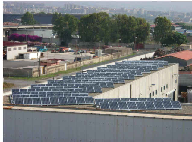
fig. 3: Spaccato dell' Impianto fotovoltaico 48,6 kWp

Strano Spa sede Zona Industriale Catania